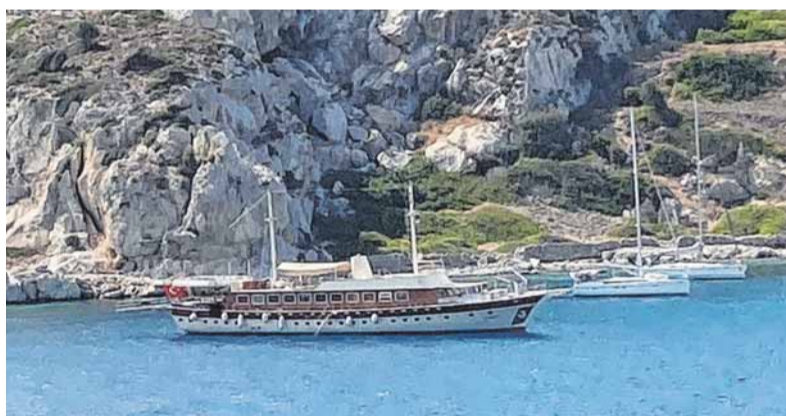
Die elegante Elara 1 ankert meist in malerischen Buchten.

Die Recherche wurde unterstützt vom Reiseveranstalter Radurlaub Zeitreisen GmbH - Inselhüpfen.