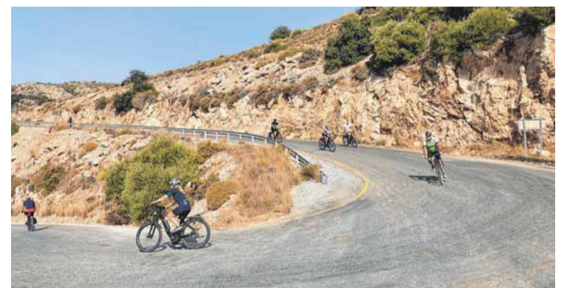
Belohnung: Wer hoch strampelt, darf anschließend rasant runterfahren.