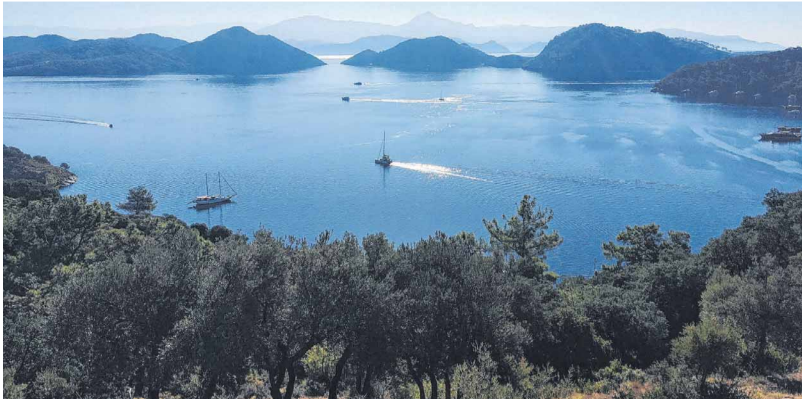
Traumhafte Ausblicke auf das Ägäische Meer bieten sich während der Radtouren am laufenden Band.

Doch egal ob auf einem modernen Pedelec oder einem herkömmlichen Drahtesel – die Bewohner der lykischen Küste winken allen Vorbeiradelnden freundlich zu. Ausnahmslos, egal ob sie am Steuer eines der wenigen entgegenkommenden Autos sitzen oder auf einem Plastikstuhl vor dem Haus oder einer Picknickdecke im Garten. Egal auch, ob jung oder alt, Mann oder Frau. Sportliche Radler in Lykien sind noch immer die Ausnahme und erregen Aufsehen. Denn während die sogenannte Blaue Reise auf Motorseglern in der Ägäis mittlerweile viele in Angebot haben, ist die Kombination aus Schiffs- und Radreise, wie sie der Konstanzer Reiseveranstalter